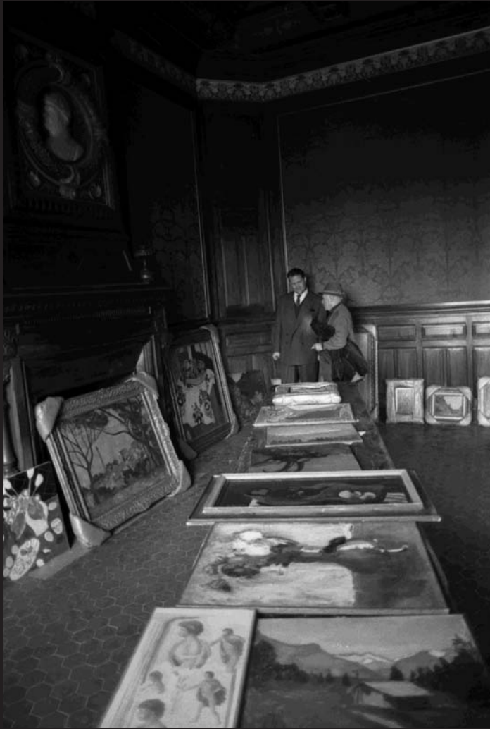
Exposició organitzada pel Musée national Picasso, París i el Museu Picasso, Barcelona